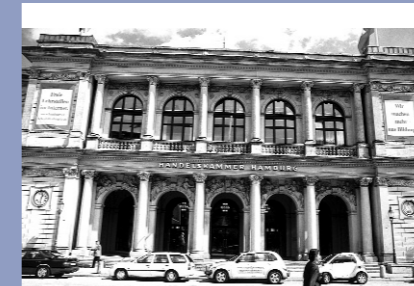
› Handelskammer: Hier geht's zur Steuertagung